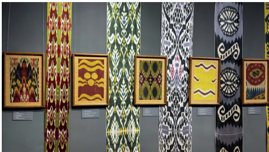
Рис.4. Абровая ткань из экспозиции Государственного музея прикладного искусства и истории ремесленничества Узбекистана.