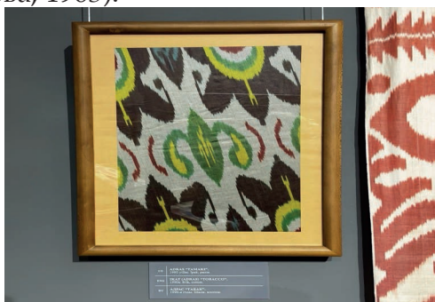
Рис.2. Абровая ткань из экспозиции Государственного музея прикладного искусства и истории ремесленничества Узбекистана.

Орнаментальные композиции музейного собрания демонстрируют значительное разнообразие художественных решений. Среди наиболее распространённых мотивов выделяются растительные, геометрические и зооморфные элементы, нередко объединённые в сложные многоуровневые композиции. Особое место занимает мотив «бодом» (миндаль), который на протяжении многих столетий сохраняет устойчивое присутствие в текстильном искусстве Центральной Азии. В традиционной культуре данный мотив связывался с представлениями о плодородии, жизненной силе и продолжении рода (Махкамова, 1963).