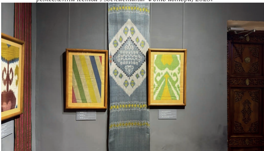
Рис.5. Абровая ткань из экспозиции Государственного музея прикладного искусства и истории ремесленничества Узбекистана.

Не менее распространёнными являются орнаменты, восходящие к образам цветов, листьев, граната и стилизованного древа жизни. Исследователи отмечают, что подобные мотивы отражают древние представления о гармонии человека и природы, цикличности времени и непрерывности жизненного процесса (Акилова, 2021). В ряде музейных экспонатов данные элементы сочетаются с геометрическими структурами, образуя сложные композиционные схемы, характерные для художественной традиции Ферганской долины. Значительный интерес представляет колористическая система абровых тканей. Для традиционного узбекского иката характерно использование насыщенных и контрастных цветовых сочетаний, основанных на взаимодействии красного, синего, жёлтого, зелёного и чёрного цветов. Подобная палитра формировалась под влиянием природных красителей и местных художественных предпочтений. Как отмечают специалисты, цвет в традиционном текстиле выполнял не только декоративную функцию, но и являлся важным носителем символических значений (Емельяненко, 2025).