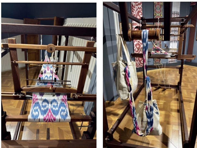
Рис.1. Ткацкий станок для изготовления абровых тканей, из экспозиции Государственного музея прикладного искусства и истории ремесленничества Узбекистана.

Название «абр» в переводе с персидского языка означает «облако», что связано с характерной особенностью рисунка ткани, отличающегося мягкими размытыми контурами и плавными цветовыми переходами. Подобный эффект достигается благодаря применению сложной техники резервного окрашивания нитей до процесса ткачества, известной в мировой практике под названием «ikat». В отличие от традиционного способа нанесения рисунка на готовую ткань, технология абрабанди предполагает предварительное окрашивание нитей основы по заранее разработанному орнаментальному замыслу, что требует от мастера высокой профессиональной подготовки, художественного мышления и точного расчёта будущей композиции (Емельяненко, 2025).